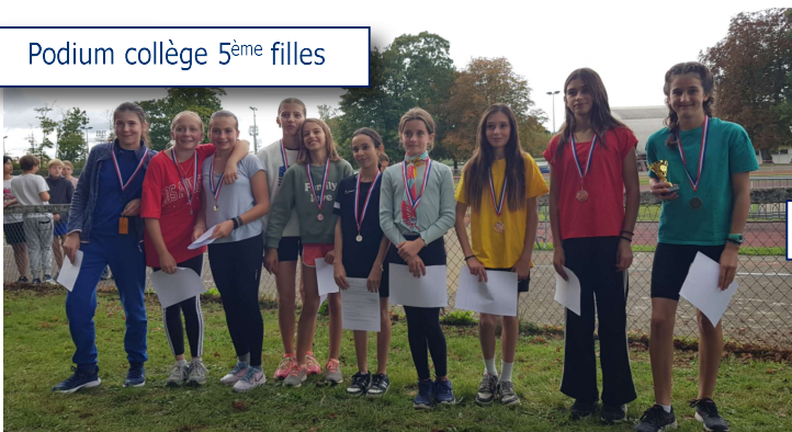
Podium collège 5 ème filles