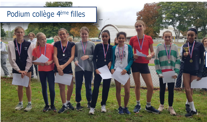
Podium collège 4 ème filles