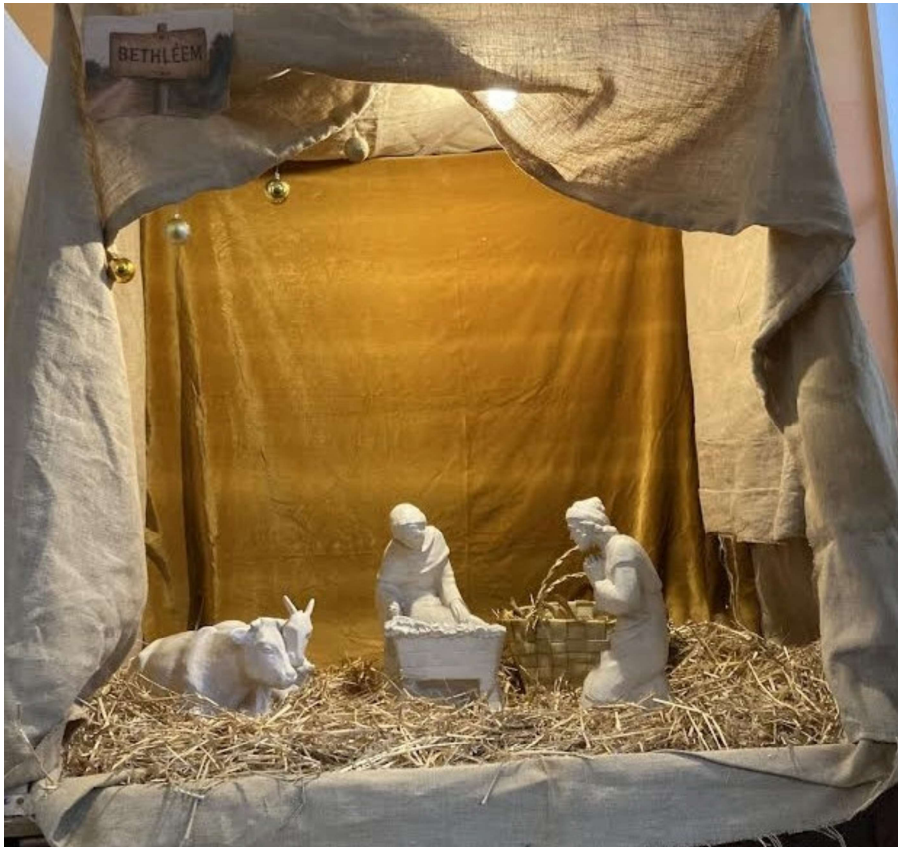
Notre crèche située à l'entrée du collège