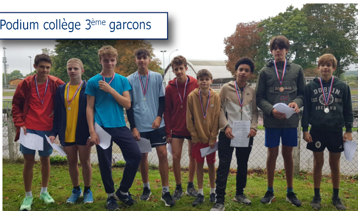
Podium collège 3 ème garçons