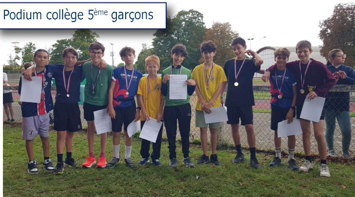
Podium collège 5 ème garçons