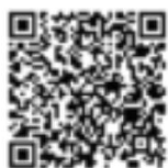
Vente de bougies

🌲 Une vente d'articles pour Noël et d'ores et déjà disponible, parlez-en autour de vous :