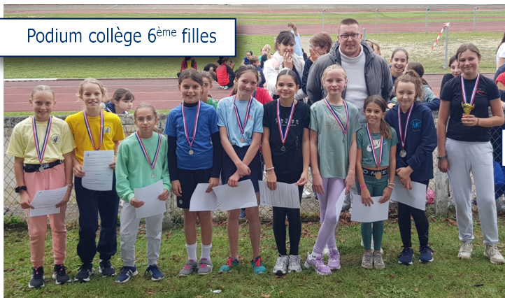
Podium collège 6 ème filles