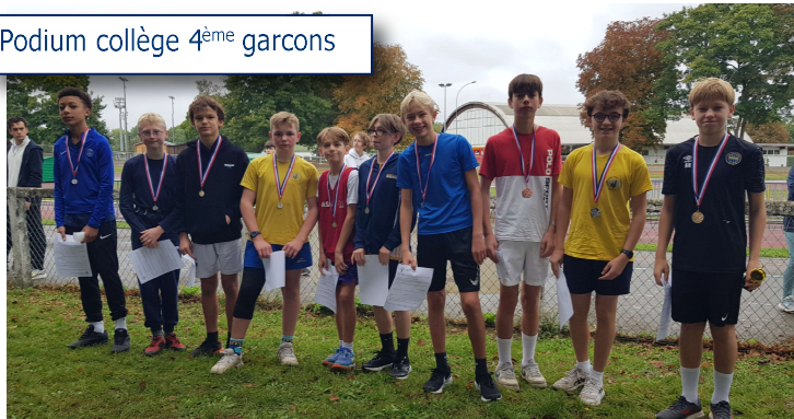
Podium collège 4 ème garçons