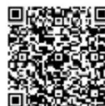
Vente de chocolat Jeff de Bruges

📅 À vos agendas : ne manquez pas nos soirées événements !