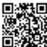
Vente de chocolats